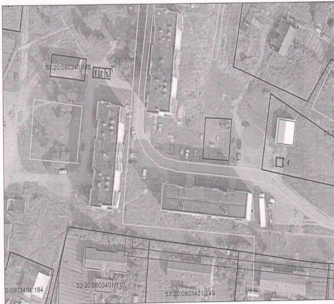
СХЕМА размещения мест продажи товаров на ярмарках с. Успенское

ул. Коммунарная - у здания 5 А - 3 места у здания 3А - место